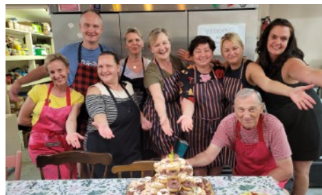
2023 m. lietuviškos stovyklos "Kretinga" virtuvės komanda