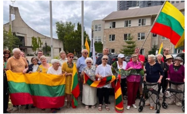
Liepos 6 d., 2 v.p.p. susirinkęs gausus būrys lietuvių giedojo tautinę giesmę..

Popiežiaus Jono Pauliaus II malda O MARIJA, Gailestingumo Motina, budėk prie visų, kad Kristaus kryžius neliktų be galios, kad žmogus nepamestų gėrio kelio, neprarastų nuodėmės supratimo, mokėtų vis labiau viltis Dievu, kuris „apstus gailestingumo" (Ef 2, 4), laisva valia darytų gerus darbus, kuriuos Dievas iš anksto paskyrė atlikti (plg. Ef 2, 10), ir visą laiką gyventų „Jo didybės šlovei" (Ef 2, 12). Amen.